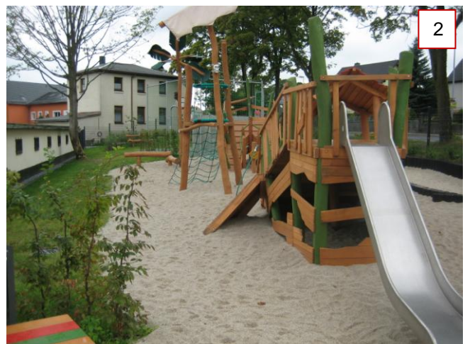
Schiffschek mit Rutsche