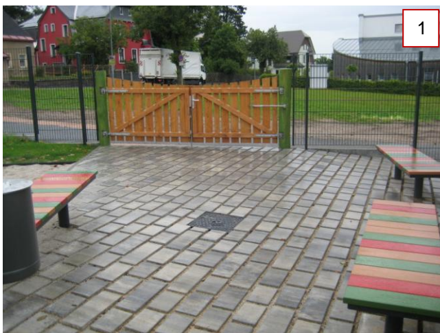
Eingangs- / Aufenthaltbereich mit Holztor und Bänken Entwurfsplanung Vorzugsvariante